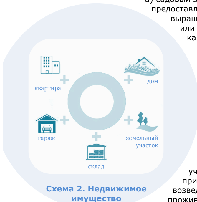
Схема 2. Недвижимое имущество